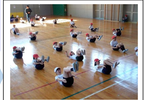
▲体育の授業における補助運動

健やかな体・・・体力向上 スポーツテストの結果分析をもとに、つけたい力に合わせて補助運動を行い、力を付けます。