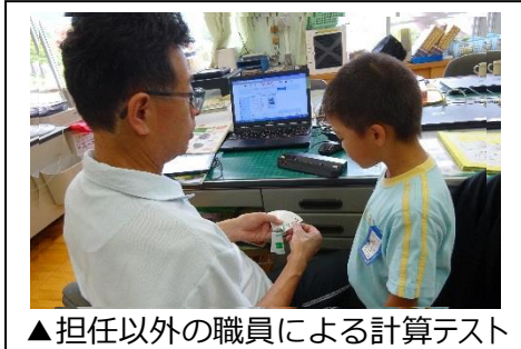
▲担任以外の職員による計算テスト

確かな学び・・・学力向上 文章を書く力や計算力をつけるよう、個々に応じて指導しています。話の聞き方・伝えるための話し方も学びます。