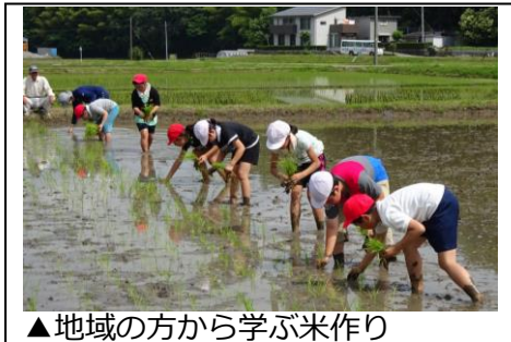
▲地域の方から学ぶ米作り

豊かな心・・・ふるさと大好き 地域の方から学んだり、地域の方と触れ合ったりして、ふるさとのよさを感じる学習をします。