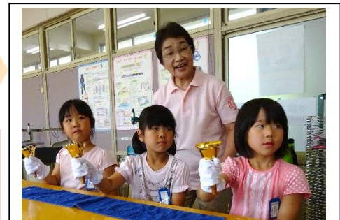
▲放課後子ども教室 ハンドベル

放課後子ども教室 3年生以下の児童は下校までの時間を利用して、英語・尺八・詩吟・盆踊り等、様々な体験ができます。