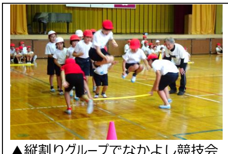
▲縦割りグループでなかよし競技会

どの子もリーダー 高学年は委員会や分団・縦割りグループで、どの子にも責任のある仕事を任せられます。リーダー性を養うとともに、その姿から低学年も学んでいます。