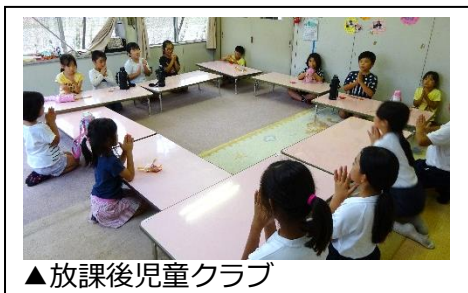
▲放課後児童クラブ

放課後児童クラブ 下校後、保護者のお迎えがあるまで宿題をしたり遊んだりして過ごします。上之郷保育園の敷地内にあり、園児と触れ合う活動もあります。