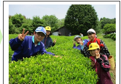
▲中学校生徒と茶摘み体験

保育園や中学校との連携 保育園でつけた力を大切に、小学校でステップアップします。中学校の教科専門の教員が授業を行い、より専門的に学びます。中学校の茶摘みを体験します。