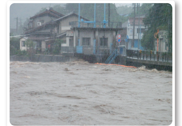
顔戸橋付近(可児川)