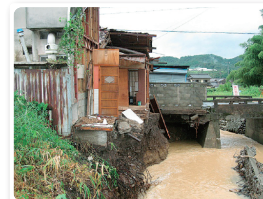
唐沢橋付近(唐沢川)