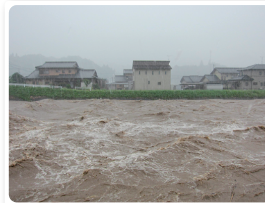
門前橋下流(可児川)