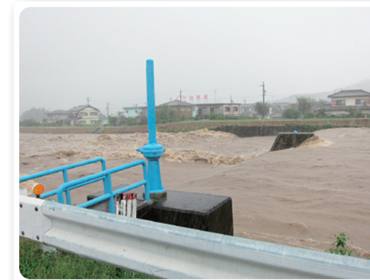
中村大橋下流(可児川)