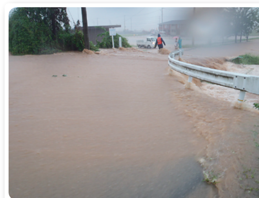
みたけの森入口付近(奥田川)