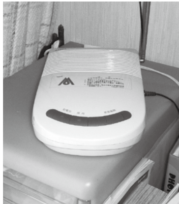
防災行政無線 戸別受信機

い方」の項目を設けるとともに、戸別受信機の貸与申し込みについて個々に案内をしている。ただ、最近では、多様な情報伝達ツールがあるためか、転入時での申し込みでなく、子どもの誕生後の成長に合わせての改めの設置申し込みが多い。 3 広報紙やホームページなどで啓発するとともに、防災関係会議などにおいても、防災担当と連携の上で呼びかけを図っていききたい。