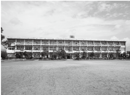
老朽化が懸念される伏見小学校