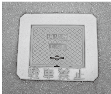
町内各所に設置してある消火栓

この火災により被災された皆様に心よりお見舞いを申し上げます。可茂消防、御嵩町消防団や人的被害を最小限に止めていただいた全ての皆様に心からお礼申し上げます。今回を教訓に充実した消防団になるよう努めていきたい。防災対策も今一度洗い直していきたいと考えている。