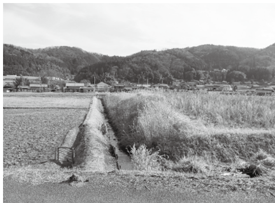
水路を挟んで左が耕作されている田、右が耕作放棄地

と共に適正な管理を促すほか、い。ご質問の両件は、地域での話し合いによる意思決定が優先されるほか、他地域からの移住・定住者の受け入れも視野に入れ新たな農業を地域で作り上げる必要と考える。