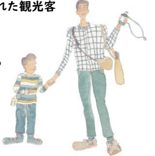
御嵩町を訪れた観光客

趣味で始めたけれど、 誰かに食べてほしい！ 気軽につくったものを 出店できるブース とかないかな…？