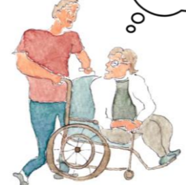
足の悪い婦人（車椅子）