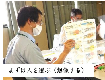
まずは人を選ぶ（想像する）

より具体的に想像しやすいよう、約50種類の人物イラストを用いて、新庁舎での過ごし方や新庁舎の使い方を話し合いました。