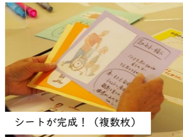
シートが完成！（複数枚）