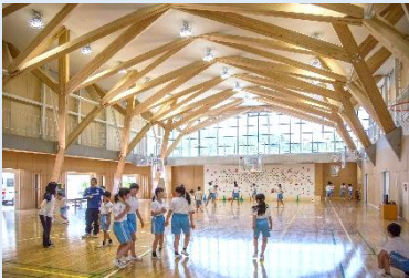
作手小学校・つくて交流館（新城市） →地域とともにつくった木造建築