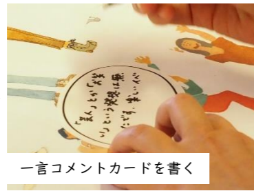
一言コメントカードを書く

多くの人にうちの「にんじん」のおいしさを知ってもらいたい！ 販売所が近くにないかなあ…。