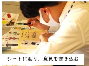
シートに貼り、意見を書き込む