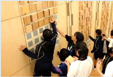
星の杜小学校（富山県魚津市） →日本初の木造3階建準耐火小学校