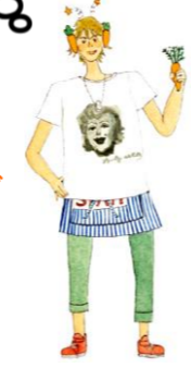
農家の息子／町外在住