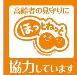
ほっとねっと 協力機関ステッカー

役場に申請し認定されることで協力機関として登録されます。ほっとねっとのステッカーやマグネットなどをお渡しますので、店舗や事業所の入り口、車などに貼って PR しましょう。