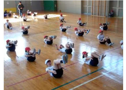
▲体育の授業における補助運動

健やかな体・・・体力向上 スポーツテストの結果分析をもとに、つけたい力に合わせて補助運動を行い、力をつけています。