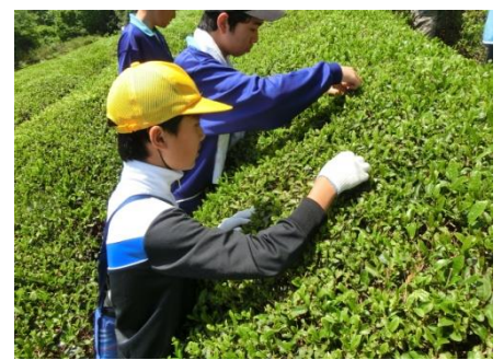
▲中学生と茶摘み体験

保育園や中学校との連携 保育園でつけた力を大切に、小学校で指導しています。中学生と茶摘みを体験するなど、連携した取組を行っています。