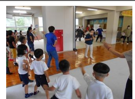
▲放課後子ども教室 盆踊り

放課後子ども教室 教育センターの方や公民館、地域講師の方々にお世話いただきながら盆踊り等を教えてもらっています。