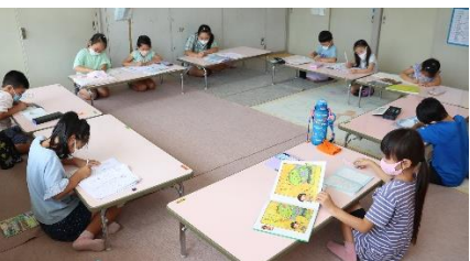
▲放課後児童クラブ

放課後児童クラブ 下校後、保護者のお迎えがあるまで宿題をしたり遊んだりして過ごします。現在は上之郷保育園の敷地内にあります。