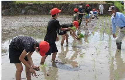
▲地域の方から学ぶ

豊かな心・・・ふるさと大好き 地域の方から学んだり、地域の方と触れ合ったりして、ふるさとのよさを感じる学習をします。