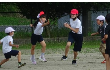
▲高学年のリーダーが進める「たてわり遊び」

どの子もリーダー 高学年は委員会や分団でどの子にも責任のある仕事を任せられます。リーダー性を養うとともに、その姿から低学年も学んでいます。