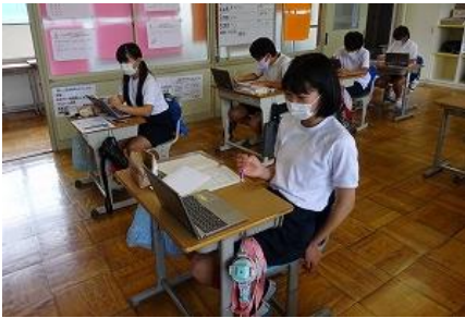
▲タブレットを使って考えをまとめる

自ら学ぶ・・・学力向上 タブレットパソコンを使って調べ学習をしたり、互いに交流したりする等、一人ひとりの課題に沿って、自ら考え、仲間と共に学びを深める授業づくりを進めています。