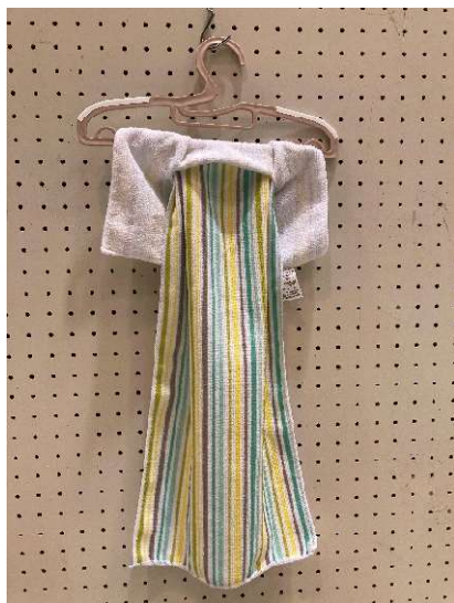
第43回 可児・御嵩 発明くふう展 作品銀賞