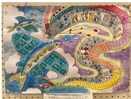
第43回 可児・御嵩 発明くふう展 絵画金賞