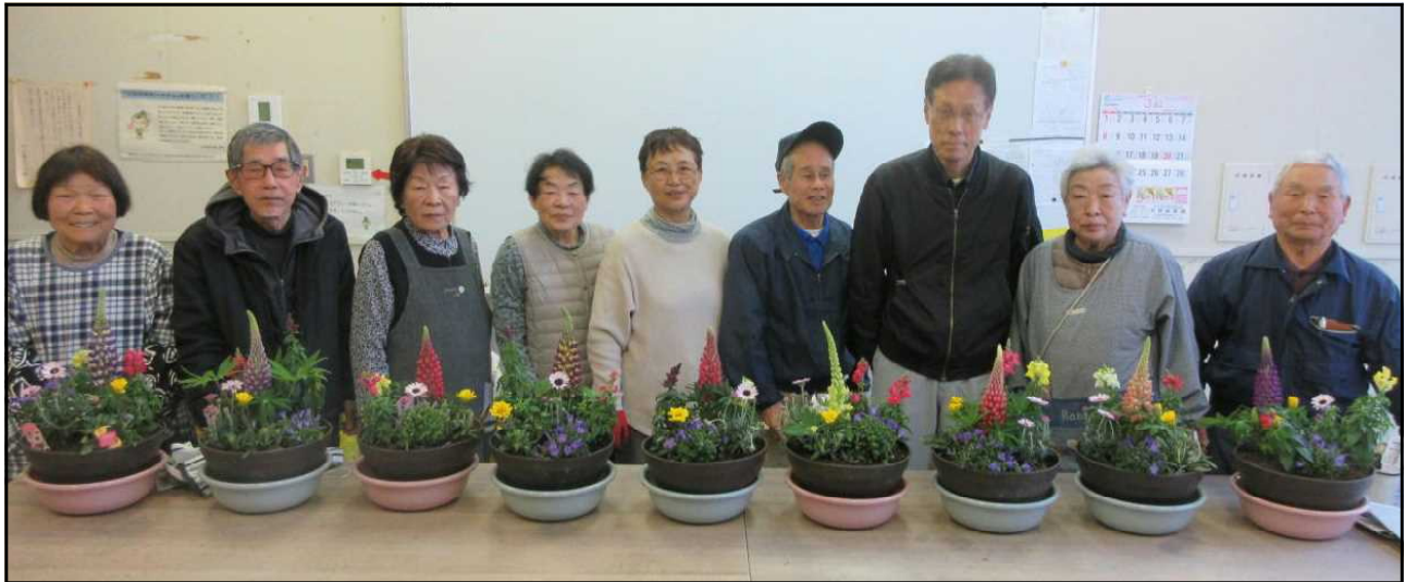
みたけ園芸部「花の寄せ植え研修会」令和8年3月14日(土)中山道みたけ館陶芸教室にて