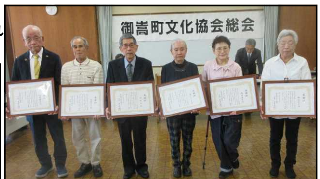
▲表彰された皆様(代理者含む)