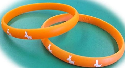
受講後にお渡しするオレンジリング

今後の新型コロナウイルス感染症拡大の状況によっては、内容の変更、開催時期を延期または中止となる場合があります。