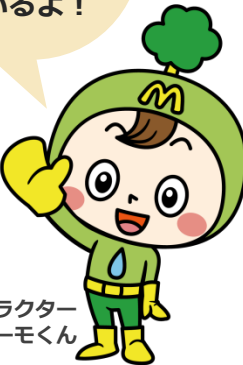
御嵩町シンボルキャラクター ミーモくん