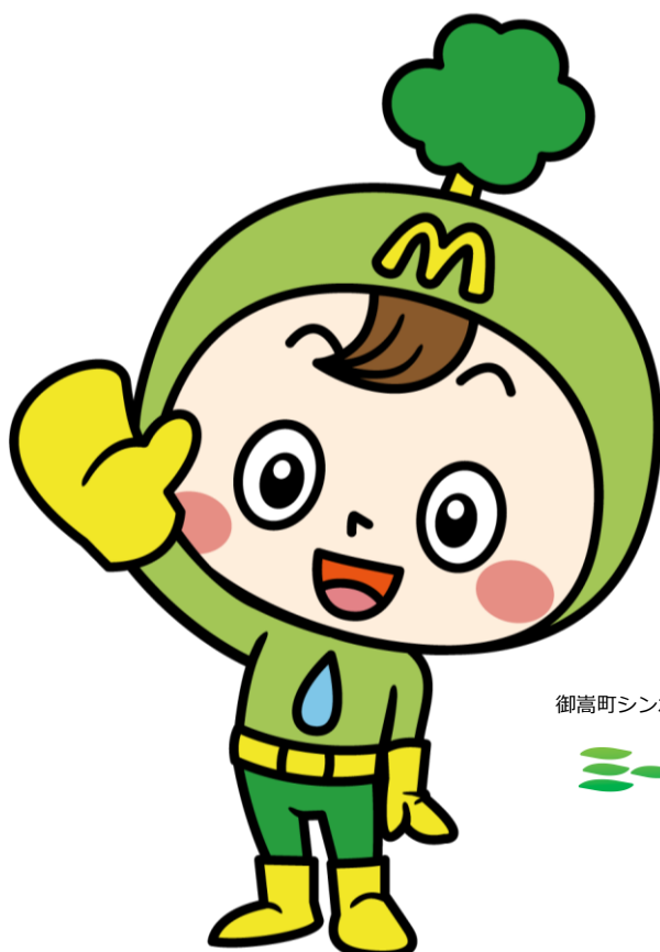
御嵩町シンボルキャラクター