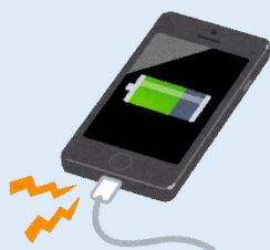
携帯電話等の充電に…