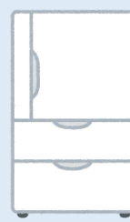
電気ポット・炊飯器・冷蔵庫などの電源に…