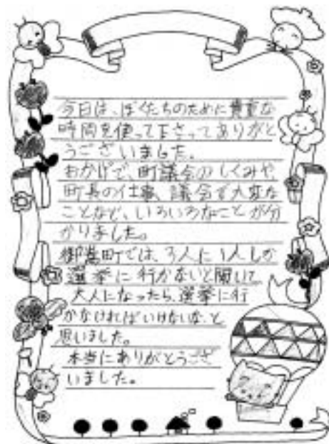
御嵩小学校児童の手紙