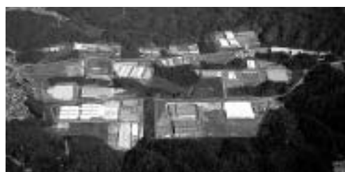
グリーンテクノみたけ