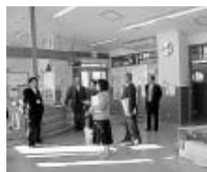
先進地視察（民文委員会）