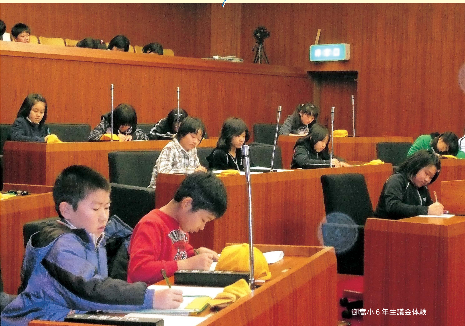
御嵩小6年生議会体験