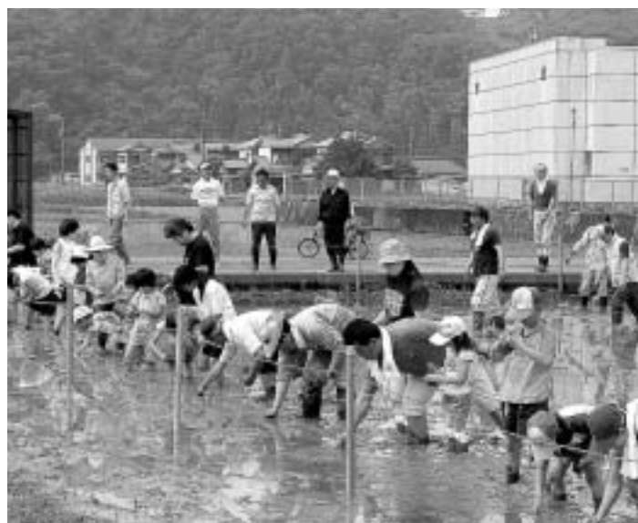
田んぼの学校風景