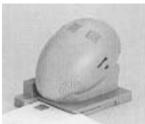
専用読み取り装置

報格差軽減と社会参加の視点から、導入する環境は整いつつあると認識しており、事業計画に盛り込んでいきたいと考えています。