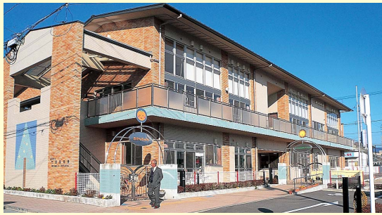
長泉町の子育て支援センター（みかんちゃん）