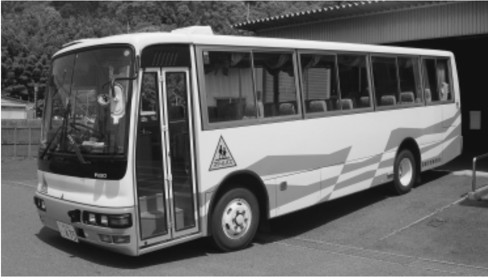
古くなったスクールバス