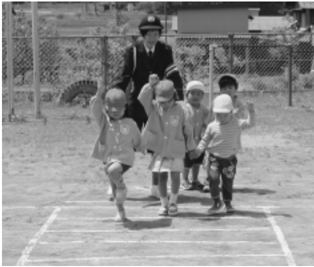
上之郷保育所交通安全教室