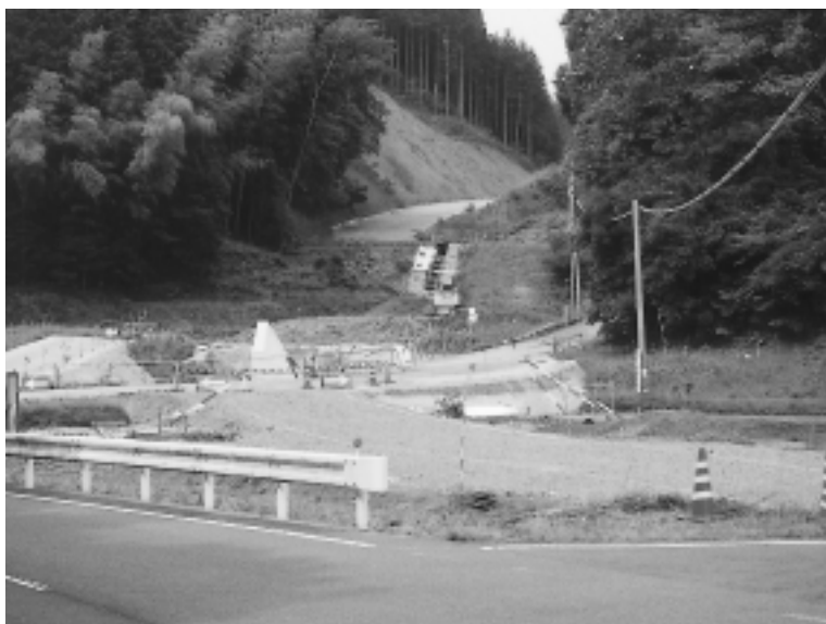
綱木地区の工事中資材運搬線

また、綱木地区の小原農道との交差点改良追加工事が十八年度中に完了すると、国道二十一号か