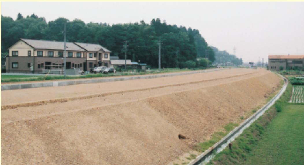
早急な建設が望まれる21号バイパス (古屋敷地内)