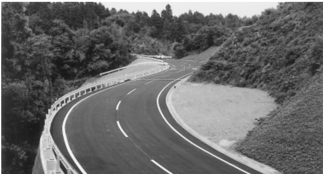
谷地区の資材運搬線