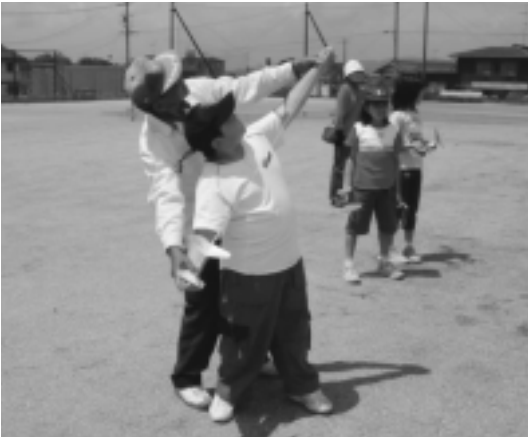
こうしてゴムの力を利用して飛ばしました。

館については認識していませんでした。今後は、管理にあたる嘱託職員の報酬、健康や労働上の問題もあり、実態に即して給与面の措置、職員の応援体制、一時的な臨時職員の雇用、夜間を無人化にして利用者責任で施設の管理など、いろいろな方策について、関係者や関係団体と十分協議を行い最善の方向を模索したいと考えています。