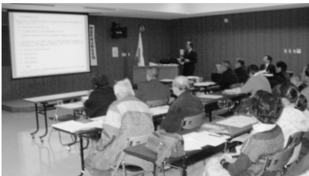
公聴会の開催（役場大会議室）