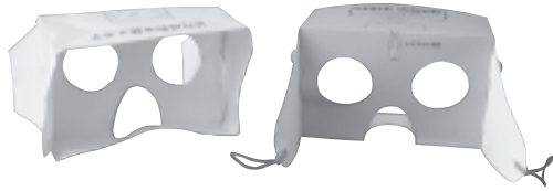
幼児視野体験メガネ

② 本年度の交通安全教室は終わっているが、別に年長者と保護者を対象に実施していく。