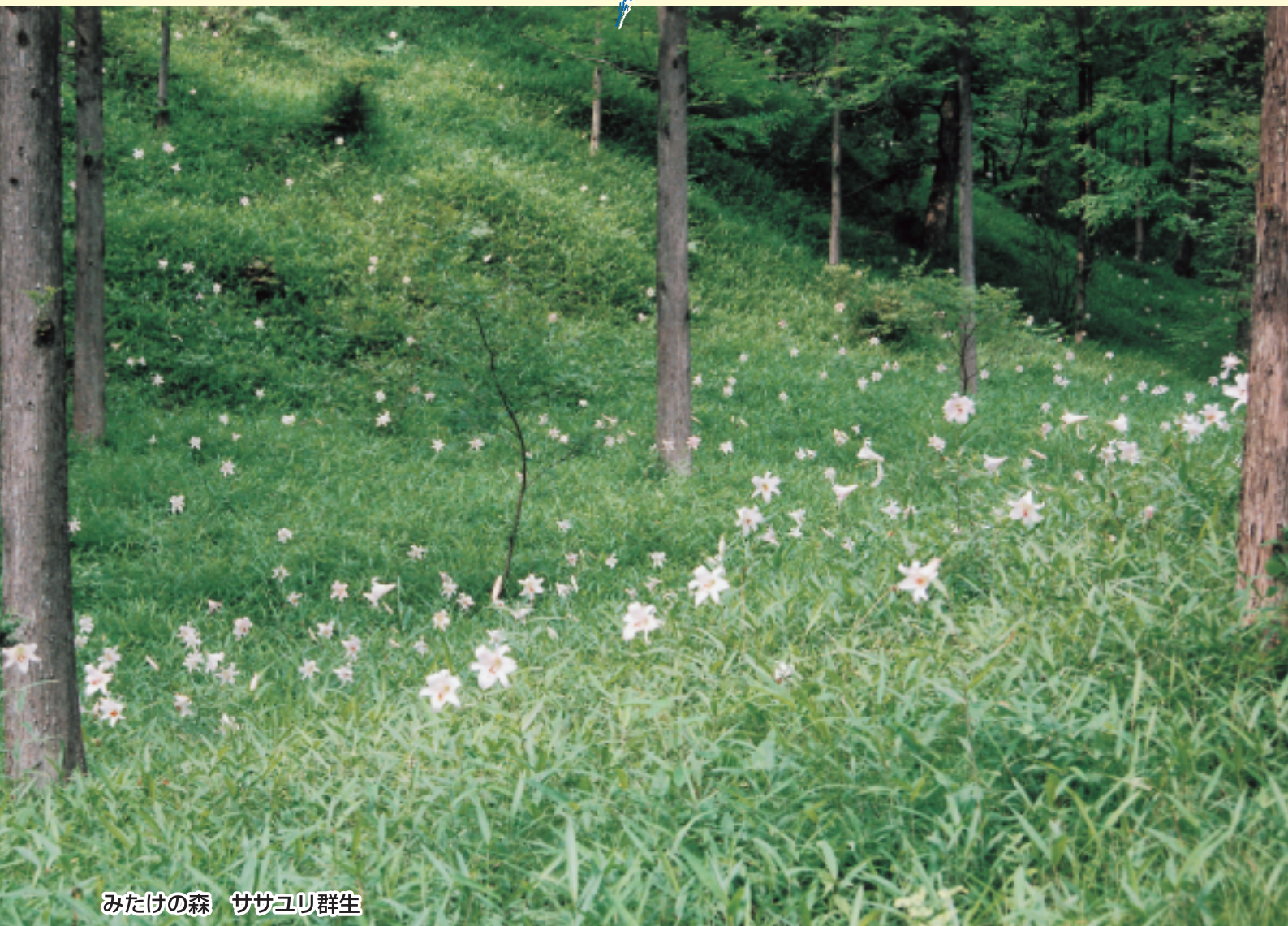
みたけの森 ササユリ群生