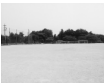
伏見グラウンド南側を望む

将来的に高齢者の体育施設、防災関連施設は必要と考える。将来的に高齢者の体育施設、防災関連施設は必要と考えるが費用的なこと、町全体の優先順位も考慮し今後も調査研究を重ねる。