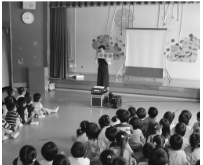
伏見保育所交通安全教室

当町では、現在、女性の交通安全指導員を一名配置されているが、予測できない事件・事故など、子どもを取り巻く環