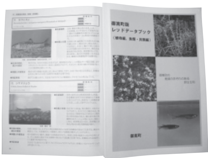
レッドデータブック

△平成十七年度御嵩町一般会計補正予算 この補正予算は、三月末に交付金と町債が確定したことと県支出金の補正、また、繰越明許費、債務負担行為、地方債