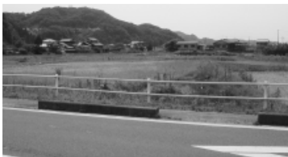
21号バイパス通過地(長岡地内)