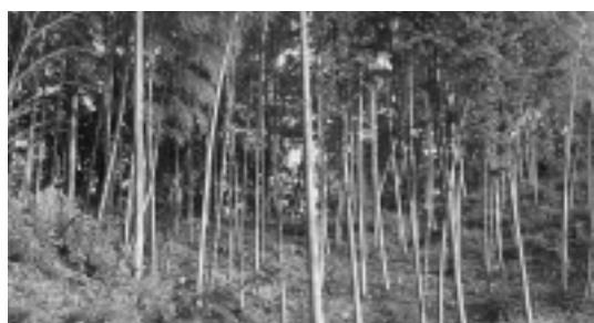
人の手が入り整備された竹林