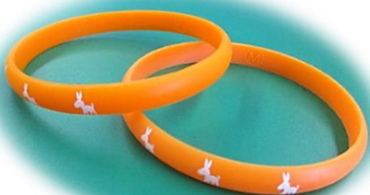
受講後にお渡しするオレンジリング

今後の新型コロナウイルス感染症拡大の状況によっては、内容の変更、開催時期を延期または中止となる場合があります。