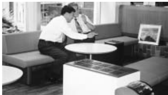
役場ロビーに設置した分煙機