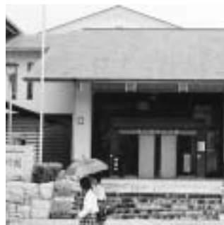
町の宝「中山道みたけ館」

中山道みたけ館は月曜日が休館日ですが、祭日に重なる日がない年はないかとあります。B&G海洋センターについてもいかが