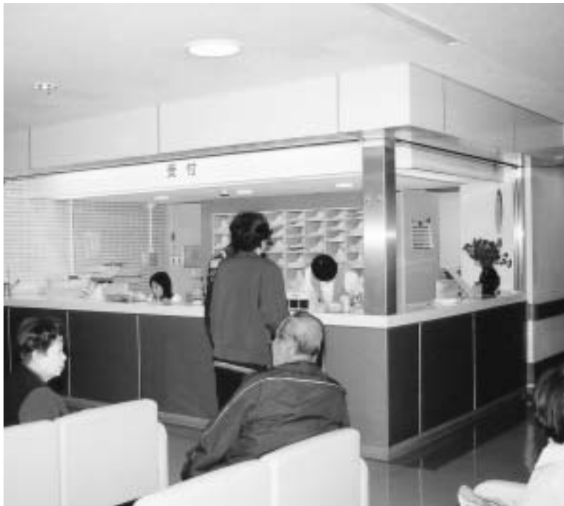
混雑する病院の窓口