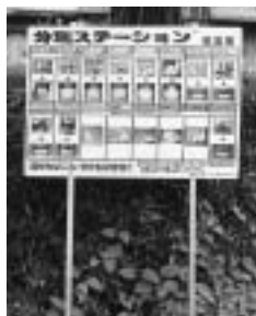
ステーション方式がスタート

資源分別収集をステーション方式でスタートさせたことにより、これまで町民の皆様方に排出時に使用して頂いた資源ごみ袋が不要となることから、第八条の資源ごみ手数料の削除を年度末に専決処分で行なったものです。