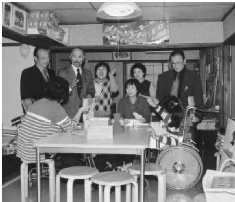
議員による町施設の訪問（民生文教常任委員会）

議会議員の報酬、費用弁償及び期末手当に関する条例改正 常勤の特別職職員の給与に関する条例改正 教育長の給与その他勤務条件に関する条例改正 これらの条例改正は、答申書のとおり、議員、町長、助役、収入役、教育長の報酬及び給与を改正するものです。 以前の改正は平成六年四