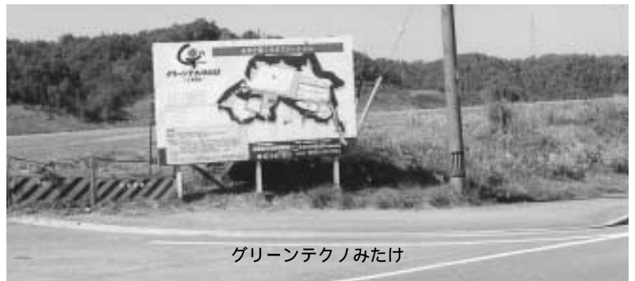
グリーンテクノみたけ