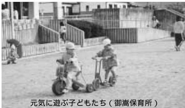
元気に遊ぶ子どもたち（御嵩保育所）

ります。中でも、今年四月から支給対象年齢が拡大された乳幼児医療費助成制度と、六月から所得制限が緩和された児童手当は、成長期の子を持つ親にとっては大変心強いものです。町内の支給対象者、申請者などの状況は、どのようになっていますか。対象者の方は、漏れなく全員申請されていますか。