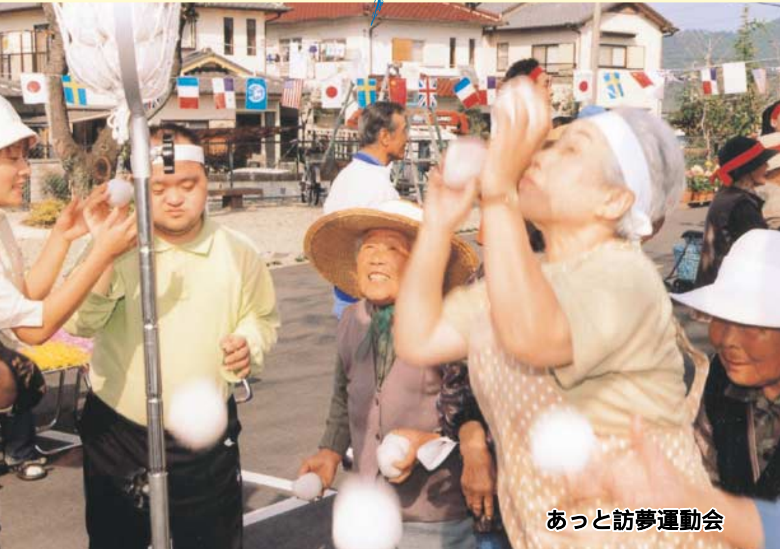
あっと訪夢運動会