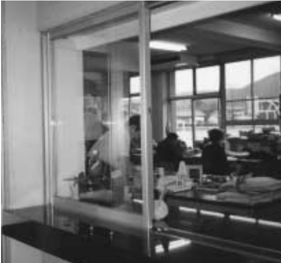
来校者は職員室の受付へどうぞ