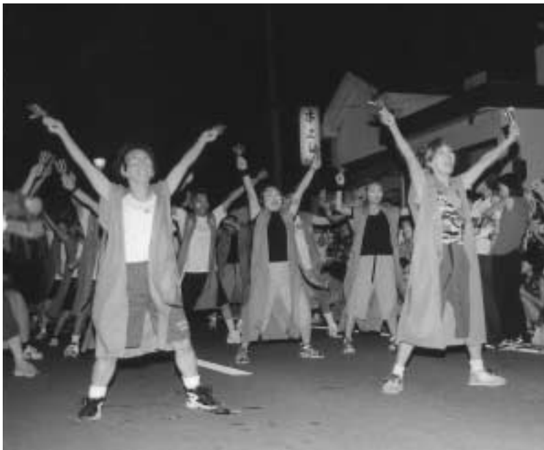
鳴子踊り「八オーみたけ」

問 「御嵩町ふるさとふれあい振興基金」による地域づくり活動助成事業に、もっと町民が参加できるように