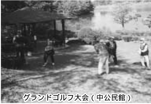
グランドゴルフ大会（中公民館）

地方交付税はご承知のとおり、国の財政状況によりまして公共事業を初めて全ての事業が見直しをされており、その中に当然、地方交付税も含まれております。平成十三年年度の交付税は前年度に比べますと約一億四千九百万円ほどの減額となっており、私たち財政を担当する者としては非常に大きな数字で大変衝撃を覚えております。この要因は二点ほどあり、一つは国勢調査による人口の減があり、算定基準の中の人口は非常に大きなウェートを占めております。もう一つはご指摘のありました財政需要額の基準額の見直しがあり、私たちが想像していたよりも大きかったということですので。平成十四年度は交付税以外にも町税・ゴルフ場利用税・使用料関係がかなり厳しい状況でありますので、予算編成はこれらに伴いかなり厳しく組まざるを得ない事になります。ただしこれとは別に経済対策の別のメニュー事業もたくさん出てきていますので、それらを詮索して積極的に利用した財政運営になると思っています。