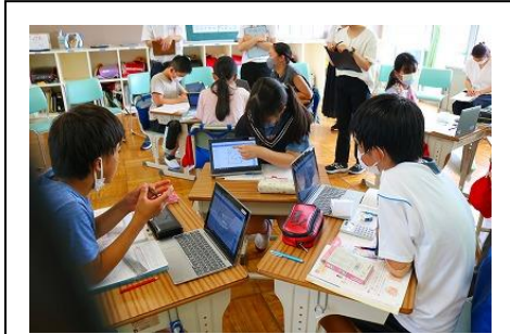
▲タブレットを使って考えを交流する