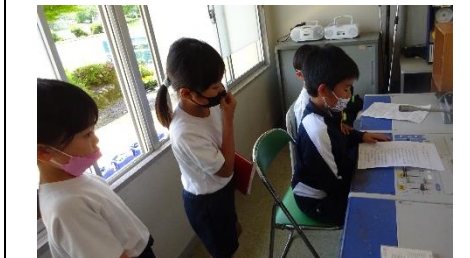
▲お昼の放送でみんなを笑顔に