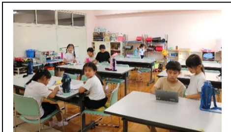
▲放課後児童クラブ