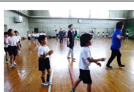
▲放課後子ども教室 盆踊り

地域講師の方々にお世話いただきながら盆踊りや軽スポーツ、詩吟等を教えてもらっています。