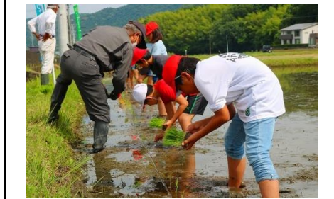
▲地域の方から学ぶ