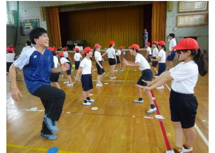
▲トップアスリートから学ぶ体育の授業

トップアスリートの方から準備運動の仕方や体の動かし方を教えてもらい、日々の授業に取り入れています。