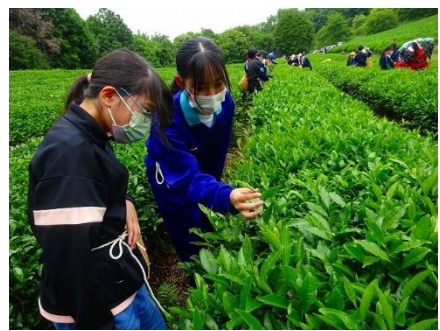
▲中学生と茶摘み体験

保育園の園児を招いての生活科まつり、中学生との茶摘み体験、高校生との英語活動や調理実習を通して、交流をしています。