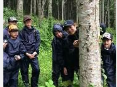
■町内在学の中中学生と水土里隊による、環境未来都市北海道下川町への視察

子どもへの環境教育を通じて、環境モデル都市の取り組みを親に伝え、地域全体に波及させる