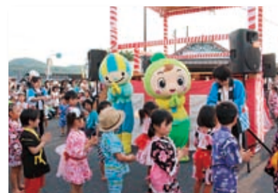
よってりやあみたけ～夢いろ街道宿場まつり～