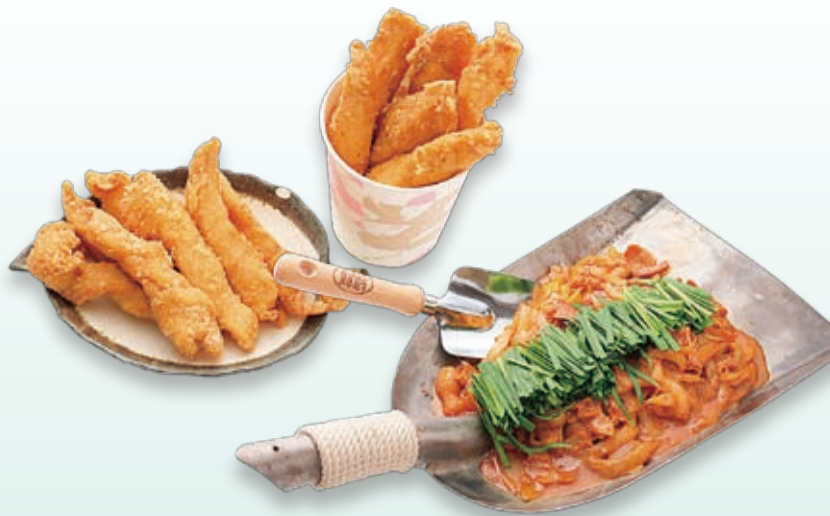
「みたけのええもん」認定品(みたけとんちゃん発展会) 元祖みたけとんちゃん…昔はスコップでも焼いていたと言われる鉄板焼きとんちゃん みたけからあげ…みたけ味噌を使って味付けしたしっとり柔らかかなからあげ