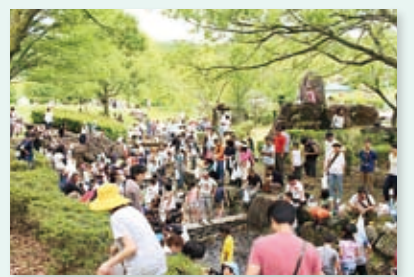
mitake no sasa saki yuri matsuri